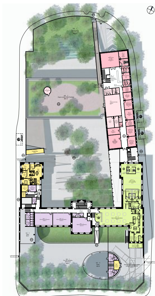
Plan du rez de chaussée de l'école élémentaire, du restaurant scolaire, du centre social et de la halte garderie - 1/200

Décines Charpieu - réhabilitation de l'école dela Soie - Architectes Carron Rampillon